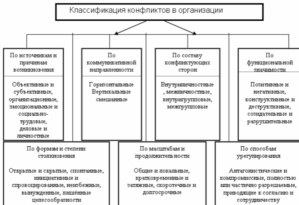
Рисунок 1.1 Признаки, типы и виды конфликтов

Возможная классификация конфликтов в организации показана на рисунке 1.1.